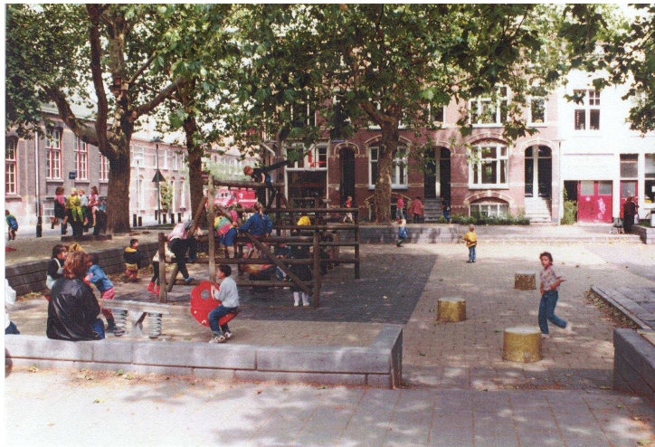
Herinrichting Koekoeksplein, Utrecht